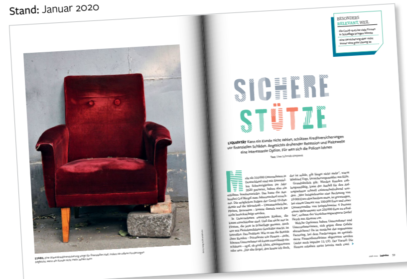
Das Extra zu unserem Artikel „Sichere Stütze“ (impulse 04/2020)